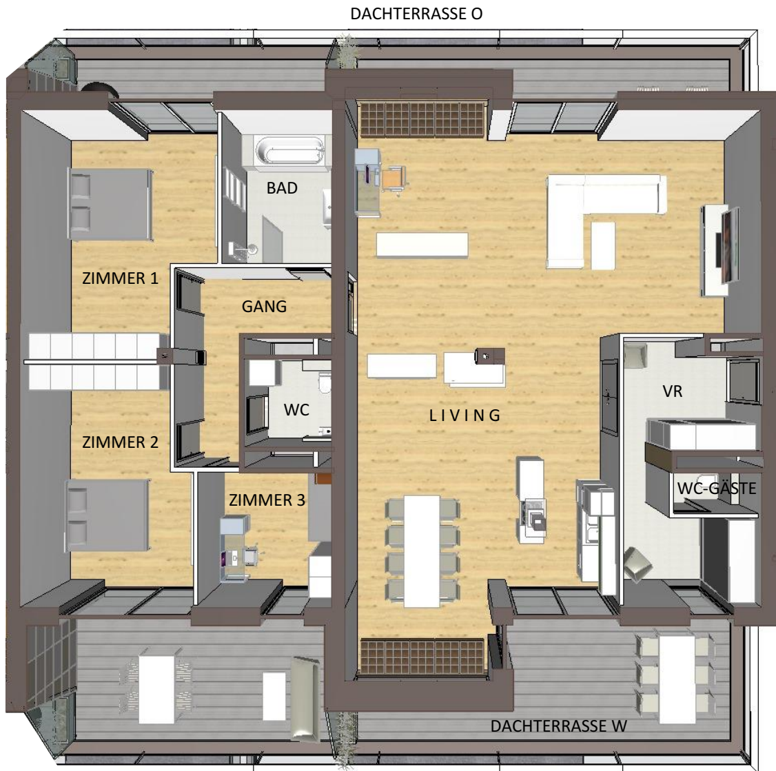
SYMBOLDARSTELLUNG DES WOHNUNGSGRUNDRISSSES 4. OBERGESCHOSS